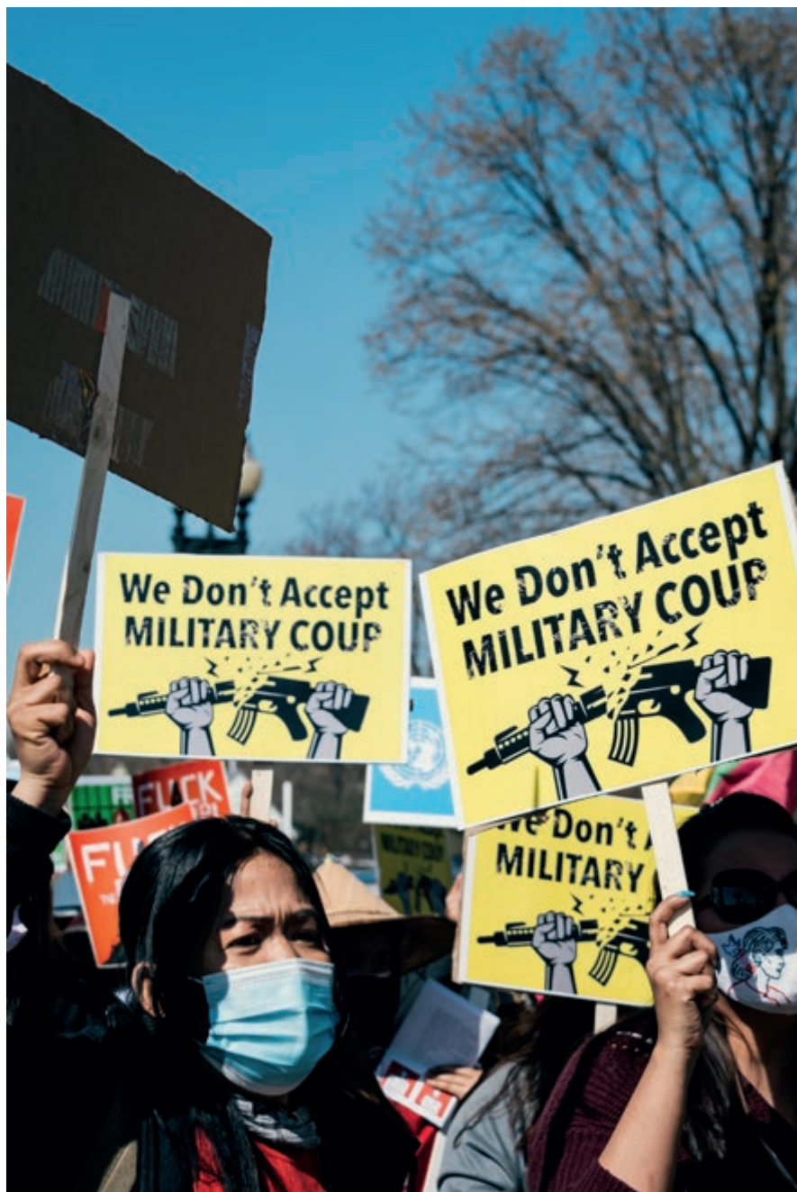
Myanmars fackföreningar deltar i demokratikampen.

Arbetstagarnas rättigheter i Bangladesh fortsätter att vara kraftigt begränsade. I landets åtta exportbearbetningszoner är fackföreningar förbjudna. Även inom klädsektorn, som är landets största industri, hindras försök till facklig organisering med brutala metoder. Även i Filippinerna utsattes fackligt aktiva förra året för våldsamma attacker, bortföranden och godtyckliga arresteringar.