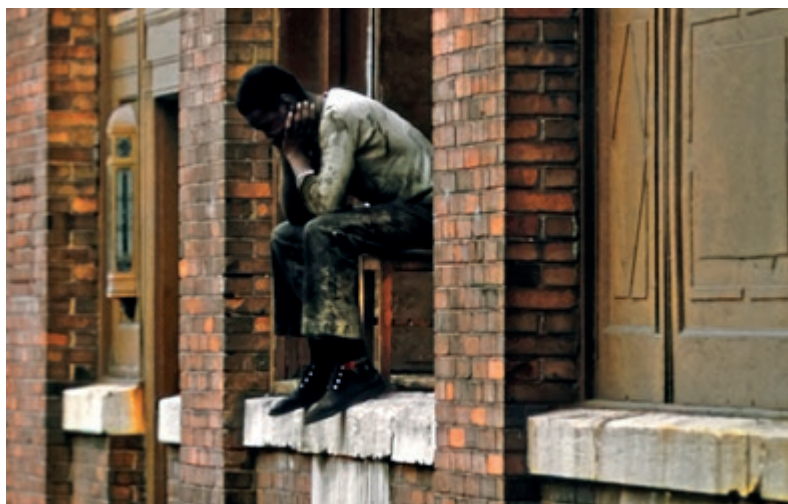
Höga kostnader och låg konsumtion riskerar att öka arbetslösheten.

Lönernas andel av ekonomin har sjunkit under årtionden. Nu slår företagens vinster rekord och reallönerna sjunker . Därför trycker fackliga organisationer över hela världen på för löneökningar och offentliga investeringar.